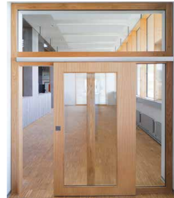
Beschlag: Hawa Suono 100, Futter: BRUNEX BLOCTool, Türblatt Silencium ALU 59