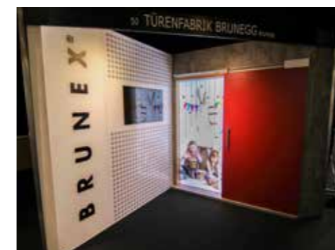
Messestand auf der architect@work, Zürich.

Mit der Vorstellung des neuen BRUNEX BLOCTool Hawa Suono Schallschutz-Schiebetürsystems sind auch alle BRUNEX Lizenzpartner startklar für den Trend und können das innovative System ab sofort selbst fertigen.